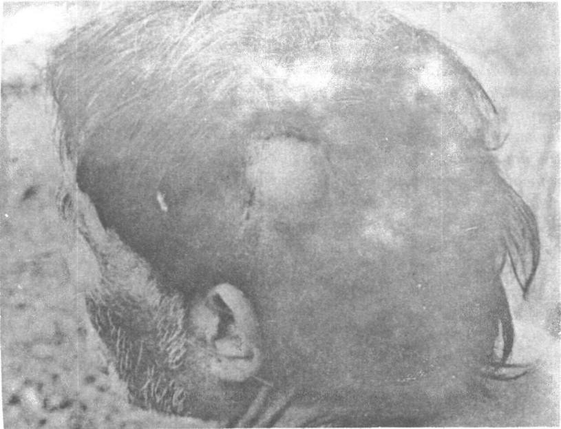
Figura I: Nódulo Oncocercótico no Couro Cabeludo em Índio Yanomámi, Serra dos Surucucus, Estado de Roraima.

elas sugadas, eventualmente, pelos insetos transmissores, nos quais se desenvolvem, em uma ou duas semanas, a fim de completar o ciclo evolutivo do parasito.