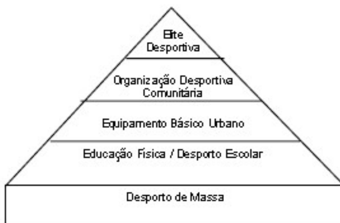
Figura 1 - Pirâmide Esportiva prevista no Diagnóstico da Educação Física e Desportos do Governo Médici. (BRASIL, 1971, p. 20 apud VERONEZ, 2005, p. 239)