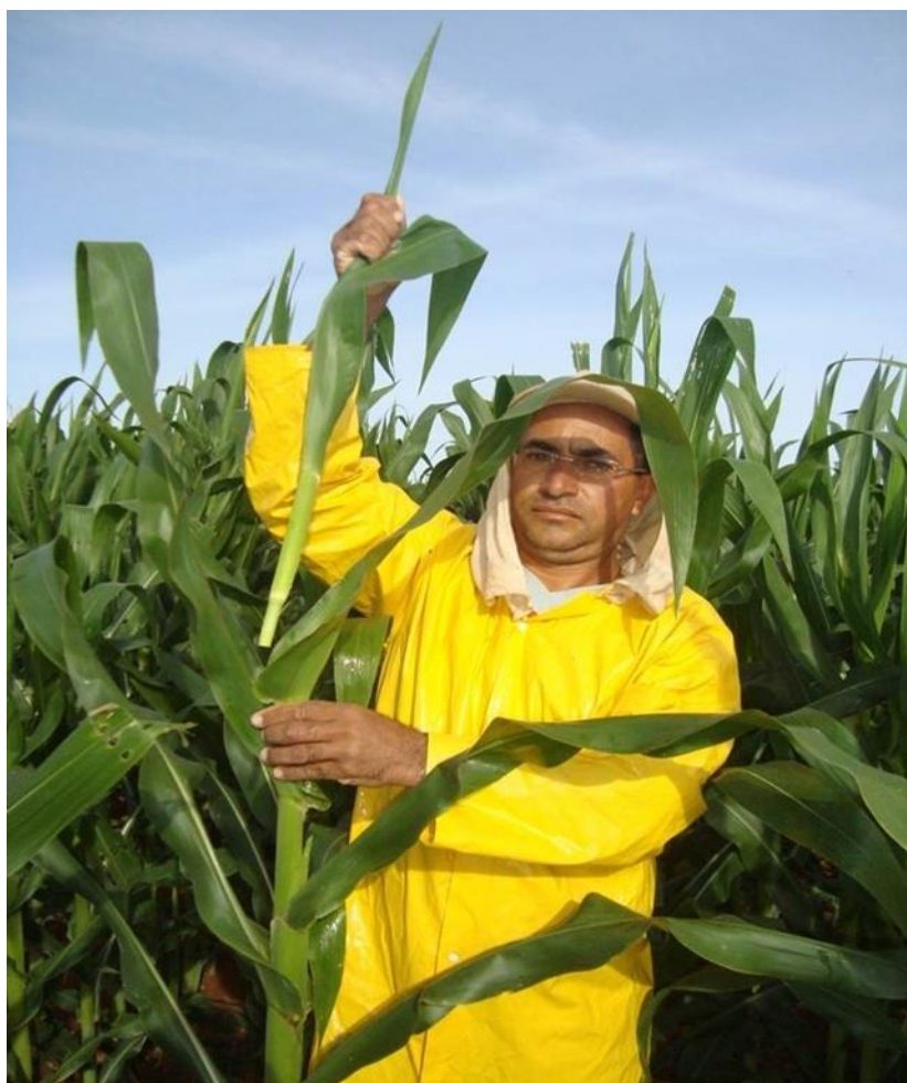
Figura 2. Despendoamento da planta de milho.

tratamentos aplicados. Os tratamentos adotados foram: 1) retirada total de folhas acima da espiga; 2) deixada uma folha acima da espiga; 3) deixada duas folhas acima da espiga; 4) deixada três folhas acima da espiga; 5) deixada quatro folhas acima da espiga; 6) retirada apenas da inflorescência masculina. A Figura 2 mostra a operação de despendoamento realizada pelo trabalhador rural.