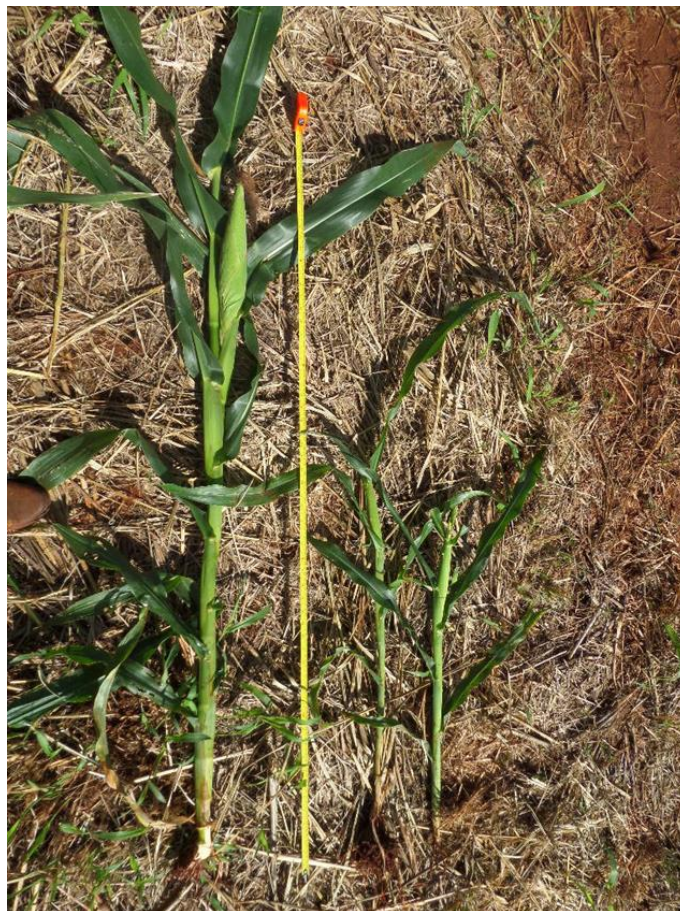
Figura 3. Planta normal dominante (esquerda) e plantas dominadas

Foram coletadas sementes oriundas de três diferentes genótipos de plantas dominadas de parentais fêmeas em três campos de produção. O híbrido simples HS4 foi obtido na Fazenda Madeira do Mocambo, em Gameleira de Goiás-GO. Na Fazenda Carapinas, em Paracatu-MG, foi obtido o híbrido triplo HT5. O híbrido duplo HD6 foi obtido na Fazenda São Carlos, no município de São Luiz do Norte-GO.