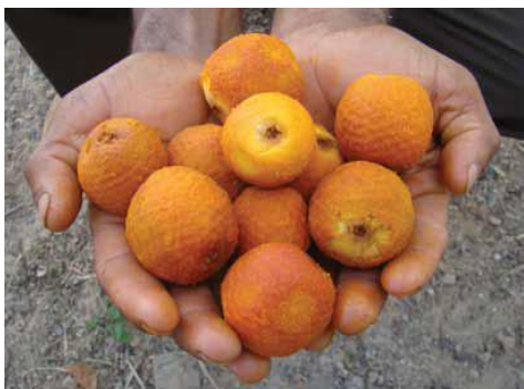
Figura: Cartilha Buriti

Do buriti dá para se fazer cestos, bolsas, esteiras e vassouras com o uso das folhas trançadas; cordas, fios para costura e rendas com a seda retirada das folhas novas, ou olhos; móveis e brinquedos dos talos das folhas; doces, sucos e óleo a partir dos frutos; artesanato com as sementes; cercas e paredes podem ser construídas com o uso dos caules; e remédios caseiros podem ser feitos com as raízes. (SAMPAIO, 2011, p.28)