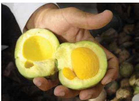
Figura: Cartilha Pequi

Os povos do Cerrado dizem que o pequi possui propriedades terapêuticas e medicinais, sendo utilizado no tratamento de doenças respiratórias, bronquite, gripes e resfriados. O extrato de suas folhas possui atividade contra micoses (fungos) e moluscos (caracóis). Algumas indústrias utilizam o pequi para fabricação e comercialização de cosméticos, como hidratante, xampu, condicionador e sabonete. (OLIVEIRA, 2010, p. 35)