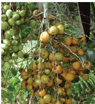
Figura: Cartilha Coquinho Azedo

O coquinho azedo não está presente apenas na alimentação dos agroextrativistas. Devido ao seu delicioso sabor e alto valor nutritivo, seus frutos têm uma ampla aceitação no mercado, sendo muito consumido na forma natural ou como sucos, picolés, geléias, licores, bolos e sorvetes. As amêndoas do coquinho azedo são utilizadas na fabricação de doces, pães, biscoitos, canjica e óleos, aumentando o potencial nutricional desses produtos. (LIMA, 2010b, p. 22).