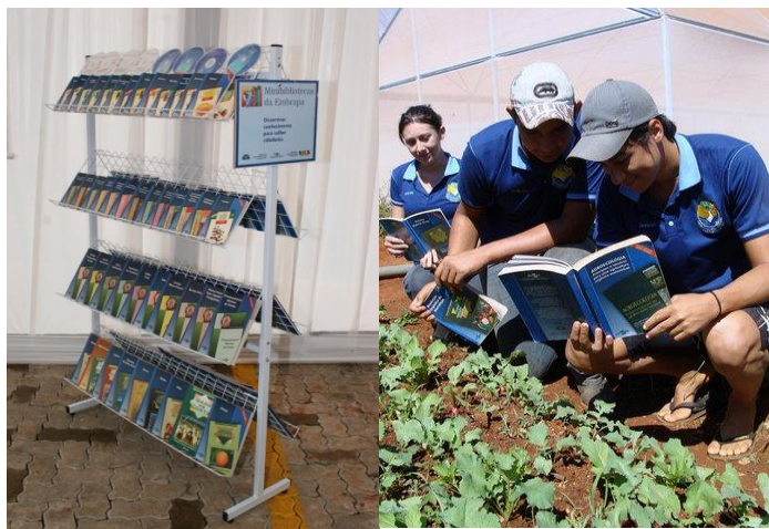
Figura 2 - Minibibliotecas da Embrapa