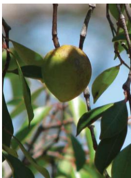
Figura: Cartilha Mangaba

Os frutos da mangabeira são muito aceitos no mercado, tanto para serem consumidos puros quanto processados. O processamento da fruta resulta em vários produtos, como polpas, geléias, sorvetes, sucos, doces, bolos, biscoitos e licores. No Nordeste, a mangaba é uma das frutas mais requisitadas na indústria de frutas nativas da região, sendo utilizada principalmente na fabricação de sucos, polpas congeladas e sorvetes. (LIMA, 2010a, p.24).