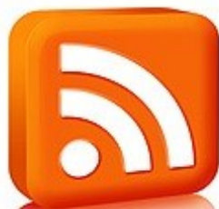
Figura 1: símbolo da tecnologia RSS

conteúdos eletrônicos. Segundo Alecrim (2005), a primeira versão do RSS foi criada pela Netscape para o seu portal My Netscape e se chamava RSS 0.90. Sem ver viabilidade do projeto, a Netscape abandona o produto. Tempos depois a Userland , empresa de menor porte, resolve continuar o RSS para utilizá-lo em seu blog . Em 2003, foi lançada a versão RSS 2.0, sob a responsabilidade da RSS Advisory Board 7 , entidade responsável por manter e atualizar essa tecnologia. A última atualização é de 2007, quando foi lançada a versão 2.0.10. A Figura 1 mostra o símbolo criado para a tecnologia RSS.