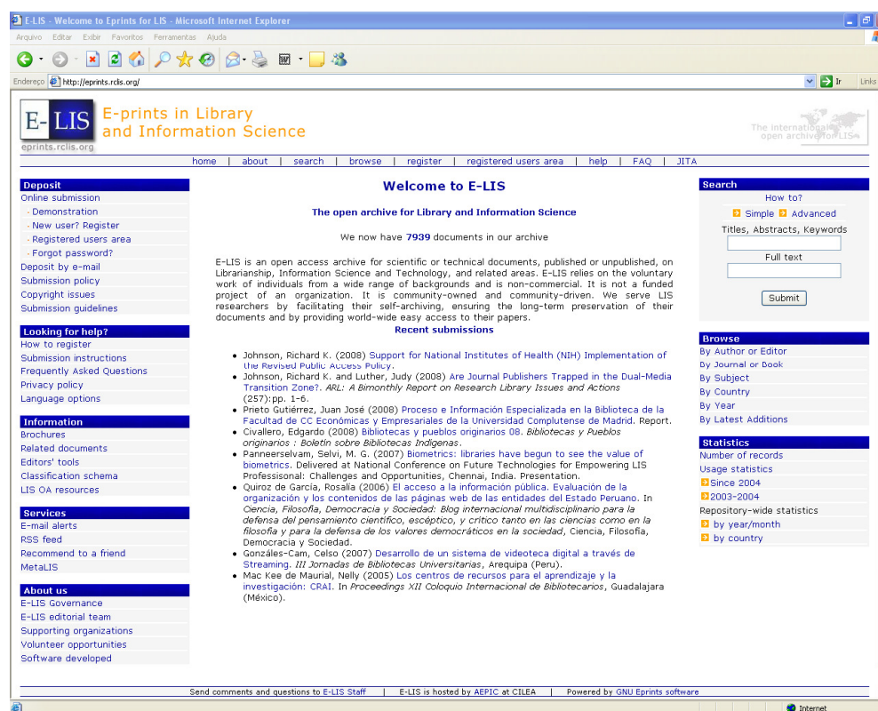
Figura 2 – Página principal do E-LIS

Entre as plataformas utilizadas para a criação de repositórios de Biblioteconomia e Ciência da Informação pode ser destacado Eprints, por ter sido o primeiro sistema a ser utilizado na construção de repositórios temáticos em arquivos abertos. Das iniciativas internacionais que usam o Eprints e que recebem maior adesão por parte da comunidade internacional da área está o repositório E-LIS ( E-prints in Library and Information Science - http://eprints.rclis.org ), estabelecido como provedor de serviços da RCLIS (Research in Computing, Library and Information Science) e mantido pelo CILEA (Consorzio Interuniversitario Lombardo per l'Elaborazione Automatica), Itália ( http://eprints.rclis.org/ ).