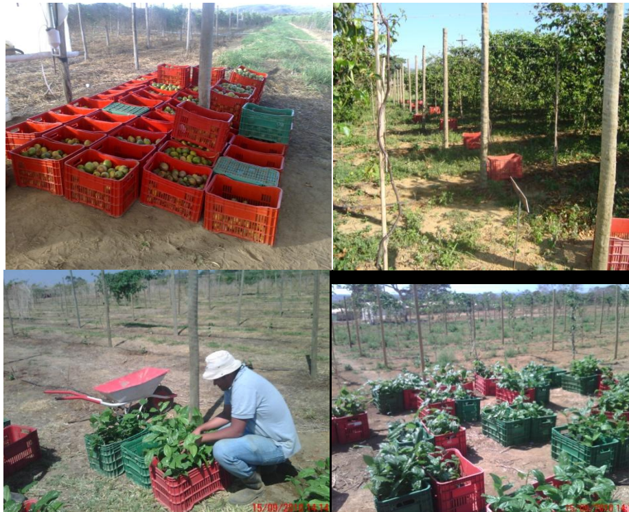
Figura A.1. Vista do experimento de campo (2009-2010), plantio de mudas e colheita por parcela. FAL-UnB.