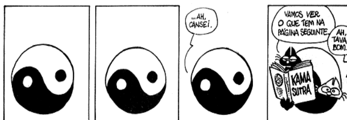
(“Kama Sutra”, Gato e Gata, Laerte)