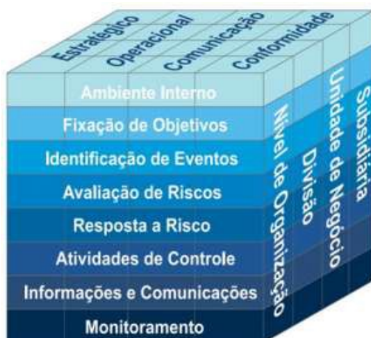
Figura 1. Modelo COSO.

O modelo é apresentado em 3 dimensões, conforme Figura 1, com o intuito de apresentar uma visão integrada dos componentes que os gestores precisam adotar para gerenciar os riscos de modo eficaz, no contexto dos objetivos e da estrutura de cada organização.