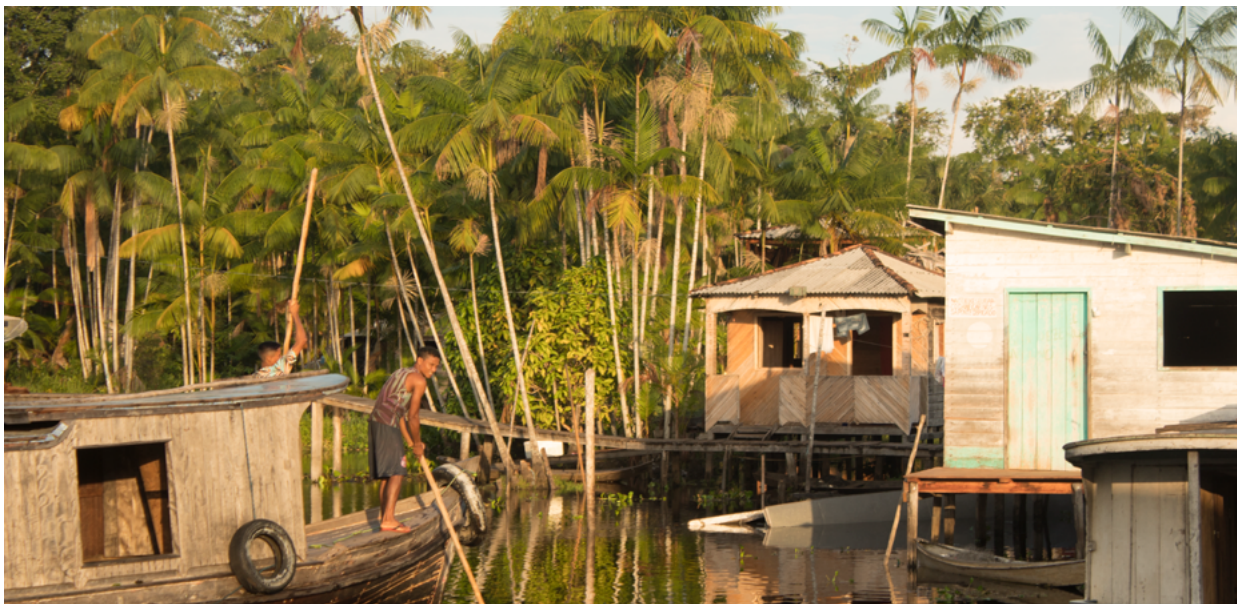
Açaizeiros da comunidade Santo Ezequiel Moreno.

renda da família. O fruto do açaí vinha sendo valorizado no mercado regional, nacional e internacional, o que também estimulou o manejo dos açaizais nativos e a sua conservação pelos ribeirinhos.