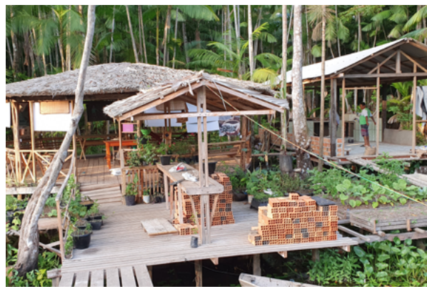
Viveiro de mudas em construção, também a partir do Fundo.