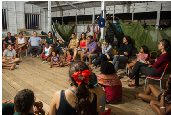
Rodas de conversa com os moradores da comunidade Santo Ezequiel Moreno.

Na comunidade Santo Ezequiel Moreno foram realizadas, durante a Vivência, rodas de conversa com os moradores, além de visitas pela floresta e pelos espaços comuns utilizados pela comunidade, como o centro comunitário, a escola, a agroindústria comunitária, a casa de farinha e outros espaços coletivos utilizados para diversas finalidades. Foram realizadas também visitas em casas dos moradores da comunidade.