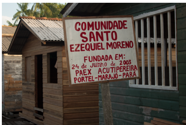
Placa que marca a fundação da comunidade.

A organização dos membros da comunidade Santo Ezequiel Moreno também possibilitou a realização e criação de outras atividades, mas o Fundo Açai foi dos mais significativos. Esse fundo tem chamado a atenção para a comunidade principalmente por ter sido construído pelos seus próprios membros com o propósito de resolver suas questões objetivas.