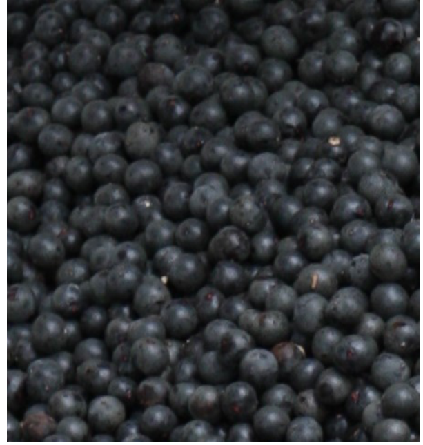
Detalhes dos frutos do açaizeiro.

Cada família da comunidade é responsável por coletar o açaí em uma determinada área de açaizeiros nativos, e essa atividade é realizada por jovens e adultos, homens e mulheres. O açaí coletado é armazenado em rasas, que são cestos de arumã, produzidos artesanalmente pelos moradores. Cada rasa armazena por volta de 15 quilos de açaí.