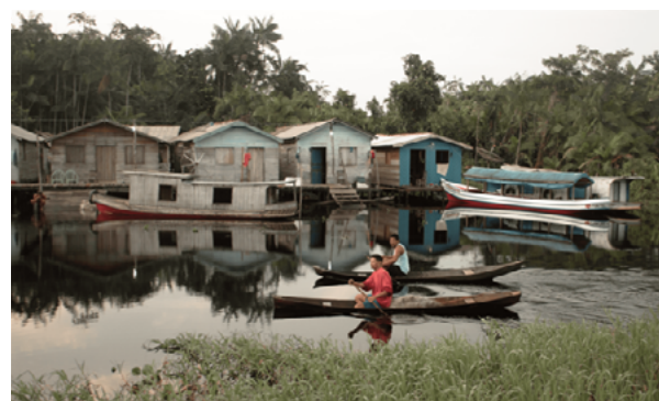
Comunidade Santo Ezequiel Moreno com suas casas e pontes peculiares.