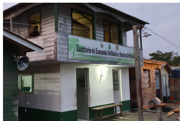
Casa da Associação dos moradores da comunidade.