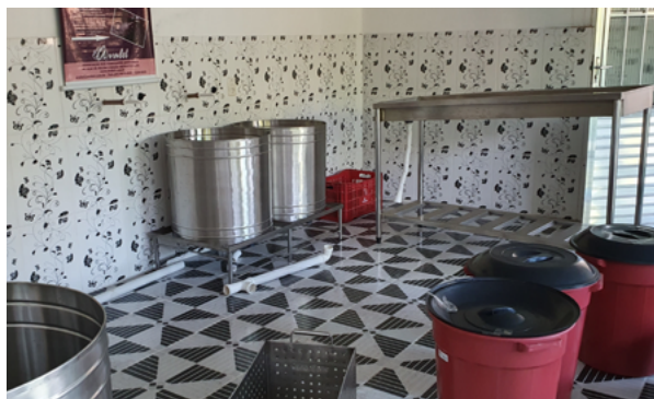
Agroindústria comunitária para o processamento do açaí e de frutos do agroextrativismo.

O Fundo Solidário Açaí proporcionou à comunidade Santo Ezequiel Moreno a construção do Centro Comunitário; a construção de mais de 650 metros de ponte, que liga as moradias na várzea às roças em terra firme; a construção de um sistema de encanação que garante água potável, proveniente de um poço artesiano, para os moradores da comunidade; a implantação de uma agroindústria comunitária para o processamento do açaí e de frutos do agroextrativismo, entre outros. Da sua criação até o ano de 2017 foram 16 ações com a participação do Fundo Solidário Açaí, segundo informações recolhidas na oficina de sistematização de experiências realizadas na comunidade com o Instituto Internacional de Educação do Brasil (MIRANDA et al., 2017).