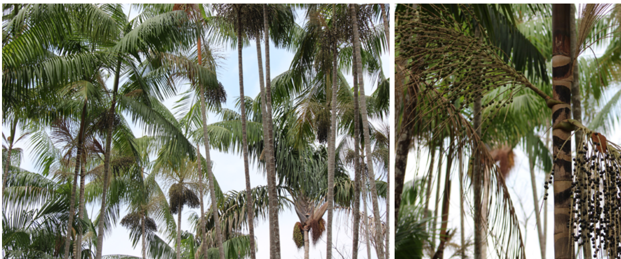
Detalhes do açazal e do açazeiro.

Mas a técnica diz que na touceira tem que ficar 5 árvores adultas, que já dá cacho, 4 jovens que ainda não deram cacho, e 3 perfilhos, que é aqueles abaixo de 1 metro. Então essa é a quantidade pra cada touceira. O espaçamento é 5m x 5m onde dá para fazer, mas sabemos que tem uma diferença muito grande do açaí de várzea para terra firme. (...) É um desafio muito grande para nós trabalhar a questão do manejo, mas tem lugar que não dá para ficar nenhuma adulta e nem o jovem, somente perfilho. Por que nesses açazais nunca foi feito o manejo, ele está numa área muito fechada de outras espécies florestais, então por isso tem que fazer uma intervenção dentro da área, para que o sol possa entrar para o açaí dar fruto (morador da comunidade).