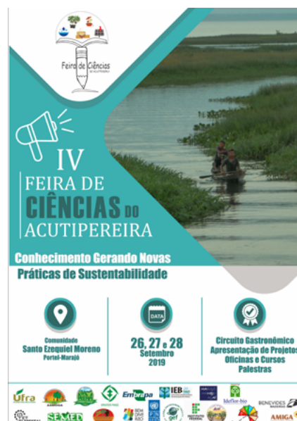
Cartazes das Feiras de Ciências do Acutipereira.