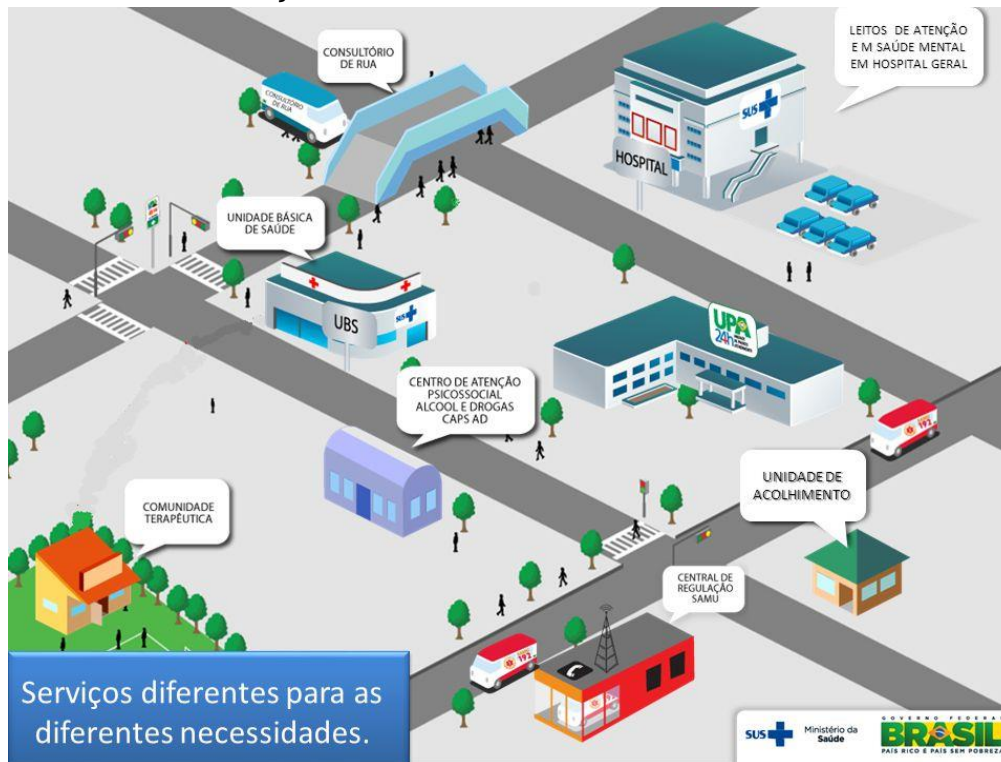
Figura 1. A Rede de Atenção Psicossocial