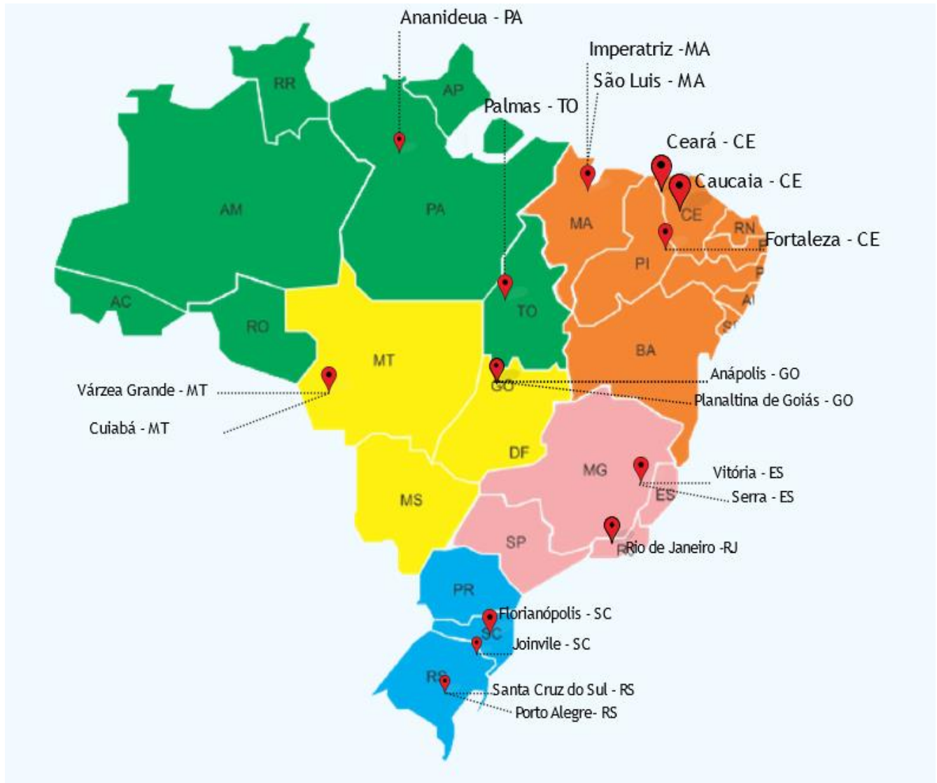
Figura 2. Mapa do Brasil com os municípios selecionados