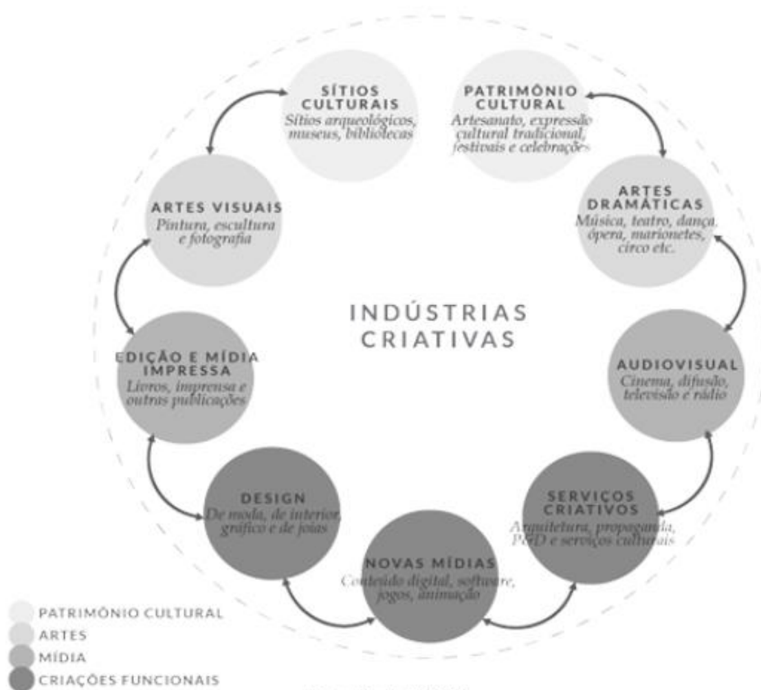
Figura 3 – Modelo da Conferência das Nações Unidas sobre Comércio e Desenvolvimento (UNCTAD)

A partir desses quatro modelos citados, a Conferência das Nações Unidas para o Comércio e Desenvolvimento (UNCTAD) propôs um novo desenho sistêmico em relatório publicado em 2010, na tentativa de unificar os modelos anteriormente propostos e pacificar as compreensões em torno da economia criativa.