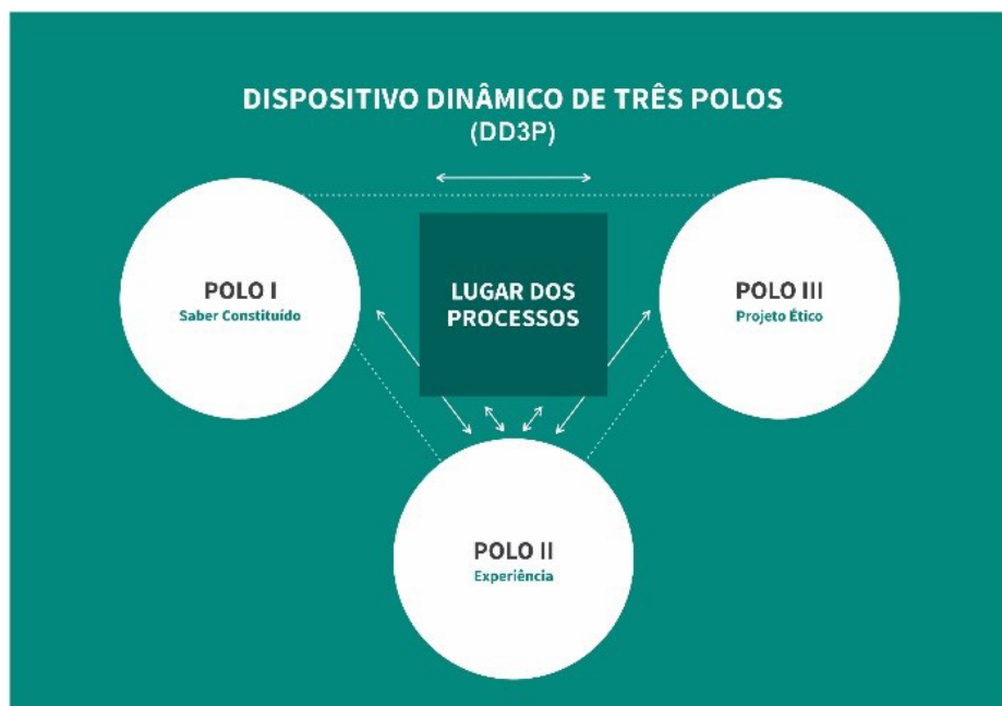
Figura 1 – Esquema metodológico do DD3P. 7,1

O terceiro polo da ação, em que se expressam questionamentos, “perguntas e respostas em duplo sentido” 7:269 , é onde se articulam os outros dois polos, com tomada de decisões considerando-se as regras, as normas e as hierarquias. É “parte integrante da organização, da concepção e do desenvolvimento de debates”. 1:104 Cada polo representa seu espaço, de forma integrada. 7 A Figura 1, ilustra o esquema metodológico do DD3P. 7,1