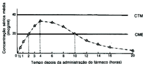
Figura 1. Curva do nível da concentração sérica obtida após a administração de um fármaco por via oral.

O ideal é que a concentração sérica do fármaco em um paciente que recebe doses corretas seja mantida entre a CME e CMT ("janela terapêutica" para o fármaco), durante o período que se deseja que o mesmo atue, de modo a garantir a segurança do paciente e a eficácia do tratamento.