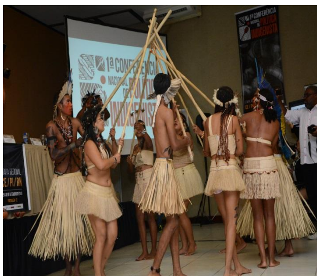
Figura 9. Apresentação da “Dança Guerreira do Povo Tapeba” antes do início do segundo dia das atividades na plenária.

Até o momento já vimos, então, serem delineadas uma série de impressões e estratégias políticas que juntas compõem um quadro complexo de referência para a compreensão do modo como a participação indígena se deu durante a realização da Conferência, em especial aqui durante a Etapa Regional do CE, RN e PI. Impressões e estratégias essas que ultrapassam em muito a ideia corrente de que as conferências são espaços privilegiadamente voltados para um “debate de ideias”, para um “diálogo entre Estado e sociedade”. Creio que há aqui envolvido muito mais do que um simples diálogo. O que pude perceber ainda a partir da observação do modo como os participantes indígenas se comportaram durante as plenárias da Etapa Regional.