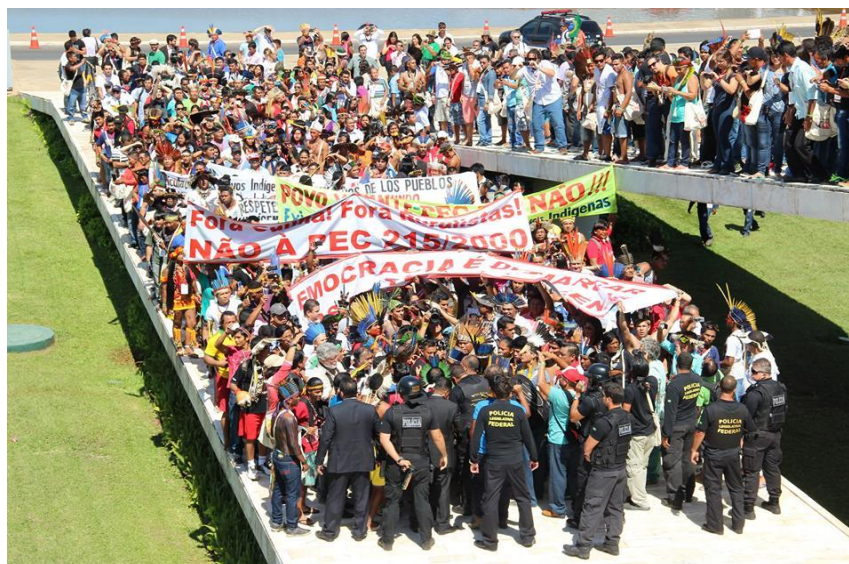
Figura 10. Manifestantes barrados na rampa de acesso ao Congresso Nacional.

de entrar não. Nós somos povo, essa casa é nossa”. À reação silenciosa dos policiais continuou: “Vocês deviam tá lá fora é prendendo bandidos. Nós somos povo! Não vamos entrar aí pra quebrar nada não”. O caso é interessante para análise por nos apontar algo no sentido da complexidade envolvendo a relação bastante heterogênea entre Movimento Indígena e diferentes dimensões do Estado. Relação essa que se modifica a depender do contexto de interação e dos distintos agentes envolvidos. Há dois dias, durante a mesa de abertura da Etapa Nacional da 1ª CNPI, diversas das autoridades de governo presentes faziam questão de ressaltar em seus discursos a ideia de que “o governo” e “os povos indígenas” estariam “juntos” construindo uma nova política indigenista para o Estado brasileiro. Mas, então, agora esses mesmo indígenas são barrados de entrar num local onde oficialmente é um dos espaços reservados para a construção das políticas nacionais.