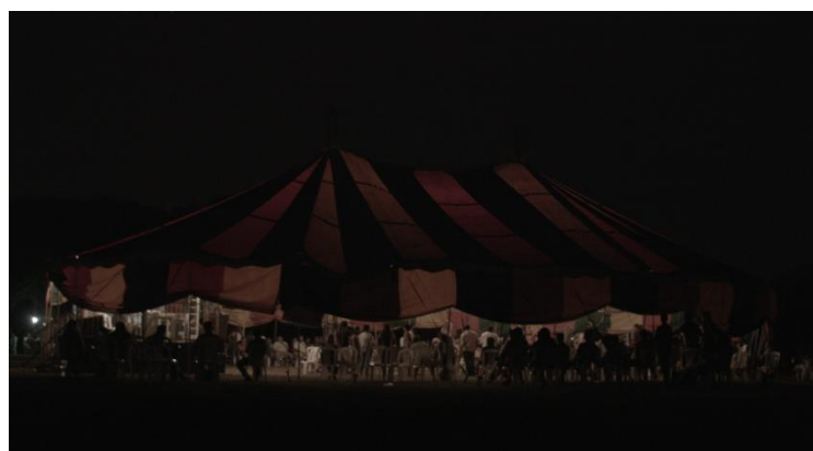
Figura 20. Tenda central na noite do último dia do 13º Acampamento Terra Livre. (Imagem: Ana Carolina Matias).