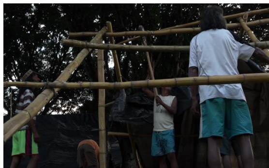
Figura 18 e 19. Participantes fazem a montagem de suas tendas. (Imagens: Leonardo Hecht).