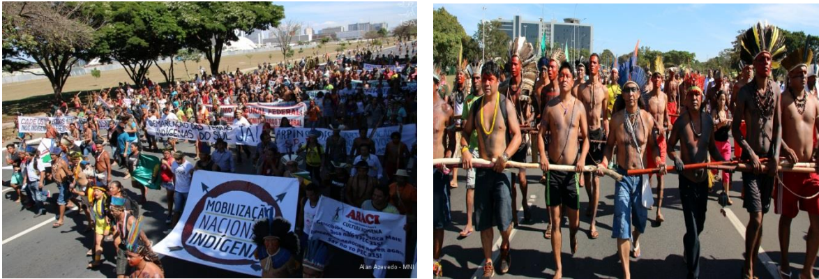
Figura 16 e 17. Realização da 2ª Marcha no dia 12 de maio de 2016.