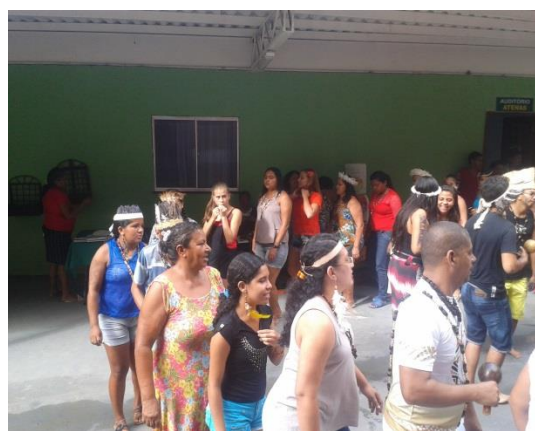
Figura 3 e 4. Realização de um toré antes do início das atividades nas plenárias.