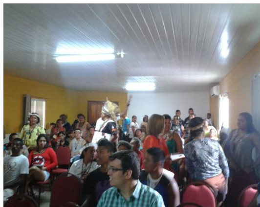
Figura 5. Apresentação da mesa de abertura do evento / Figura 6. Participantes organizando-se na plenária

Se num primeiro momento, então, a Assembleia se presta a um caráter mais formativo e informativo (no sentido mesmo de buscar instruir os participantes sobre o contexto da luta do Movimento), a partir da exposição dos eixos temáticos da Conferência, num segundo momento trata-se mais propriamente de colocar esses aprendizados em prática. É o momento de elaboração das propostas. Para tal foram, então, organizados seis Grupos de Trabalho, cada qual correspondendo a um dos seis eixos temáticos da Conferência. Os participantes foram divididos entre os GTs segundo a opção escolhida por eles mesmos ainda no momento do credenciamento. O GT que contou com o maior número de integrantes foi o do eixo temático 1 (Territorialidade e o Direito Territorial dos Povos Indígenas), o que mostra uma preocupação central dos indígenas em relação a essa temática. A pedido dos coordenadores do evento, aquelas pessoas que ainda não estivessem inseridas em nenhum dos GTs deveriam