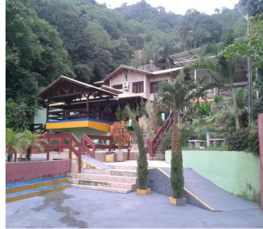
Figura 1. Chegada dos participantes ao local do evento. / Figura 2. Centro de Treinamento Acrópole.

Retomando o fluxo dos acontecimentos, os participantes, então, ao chegarem ao local do evento foram realizar o credenciamento. Estavam admirados com a beleza do local e teciam entre si diversos elogios. O local chama-se Centro de Treinamento Acrópole e trata-se de uma casa especializada na realização de grandes eventos como este e, por isso, comporta uma estrutura, de fato, bastante agradável. Realidade essa muito diferente da de outras Etapas Locais que tiveram suas Assembleias realizadas em espaços improvisados, a maioria em escolas da própria comunidade. A realização do credenciamento de todos os participantes indígenas e não-indígenas que estivessem na Assembleia, foi uma das exigências presentes no Caderno de Orientações Metodológicas voltado para as Etapas Locais que, apesar de considerar estas etapas como sendo mais livres e informais, “espaços autônomos dos povos indígenas”, e que deveria seguir as suas formas próprias de organização social, nos moldes das grandes assembleias dos povos indígenas (FUNAI, 2015: 06), recomendava firmemente aos coordenadores de cada uma das etapas um registro sistemático de todas as atividades. A começar pelo credenciamento. Não foi estipulado, porém, para estas etapas, um número limite de participantes e por isso vemos grandes diferenças de pessoas presentes entre uma etapa e outra.