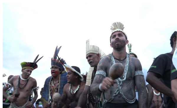
Figura 14 e 15. Realização da 1ª Marcha no dia 11 de maio de 2016.