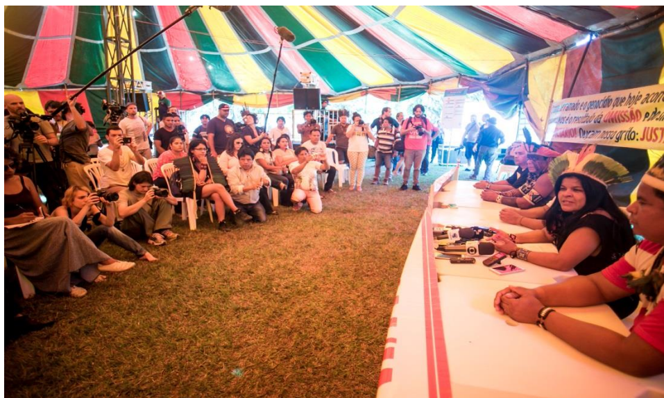
Figura 13. Coletiva de imprensa que deu início às atividades do 13º Acampamento Terra Livre.