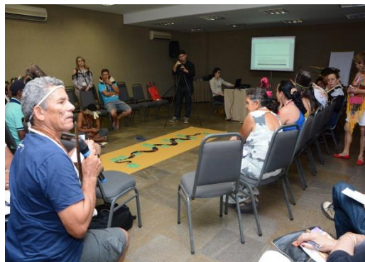
Figura 7. Apresentação da mesa de abertura do evento. / Figura 8. Roda de Conversa sobre o eixo temático 4. (Fotos retiradas do site da Conferência).