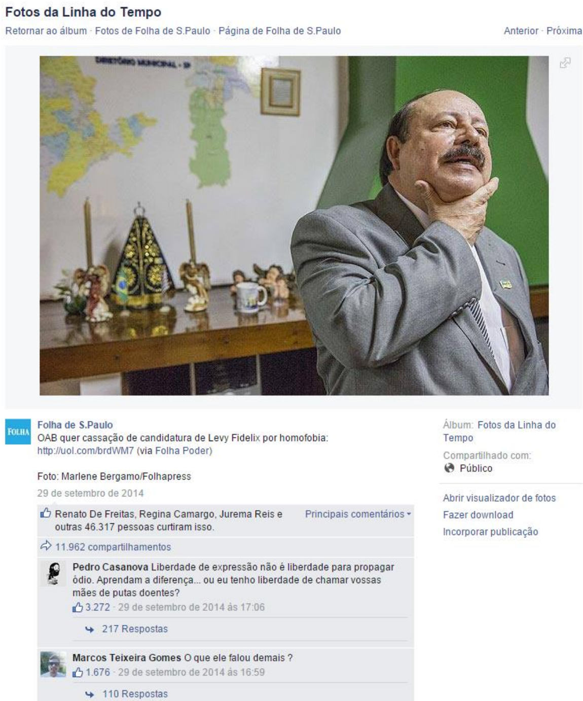
Figura 08: Postagem no Facebook do jornal Folha de S. Paulo de 29 de setembro de 2014

Fonte: página oficial do jornal no Facebook 138