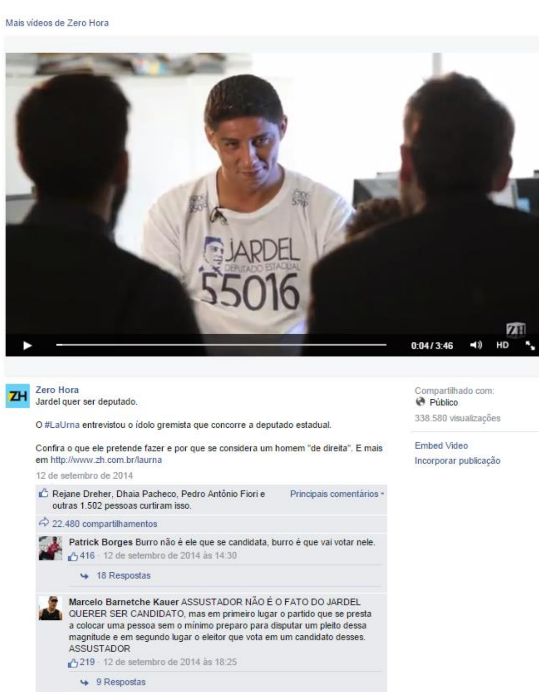
Figura 05: Postagem no Facebook do jornal Zero Hora de 12 de setembro de 2014

135