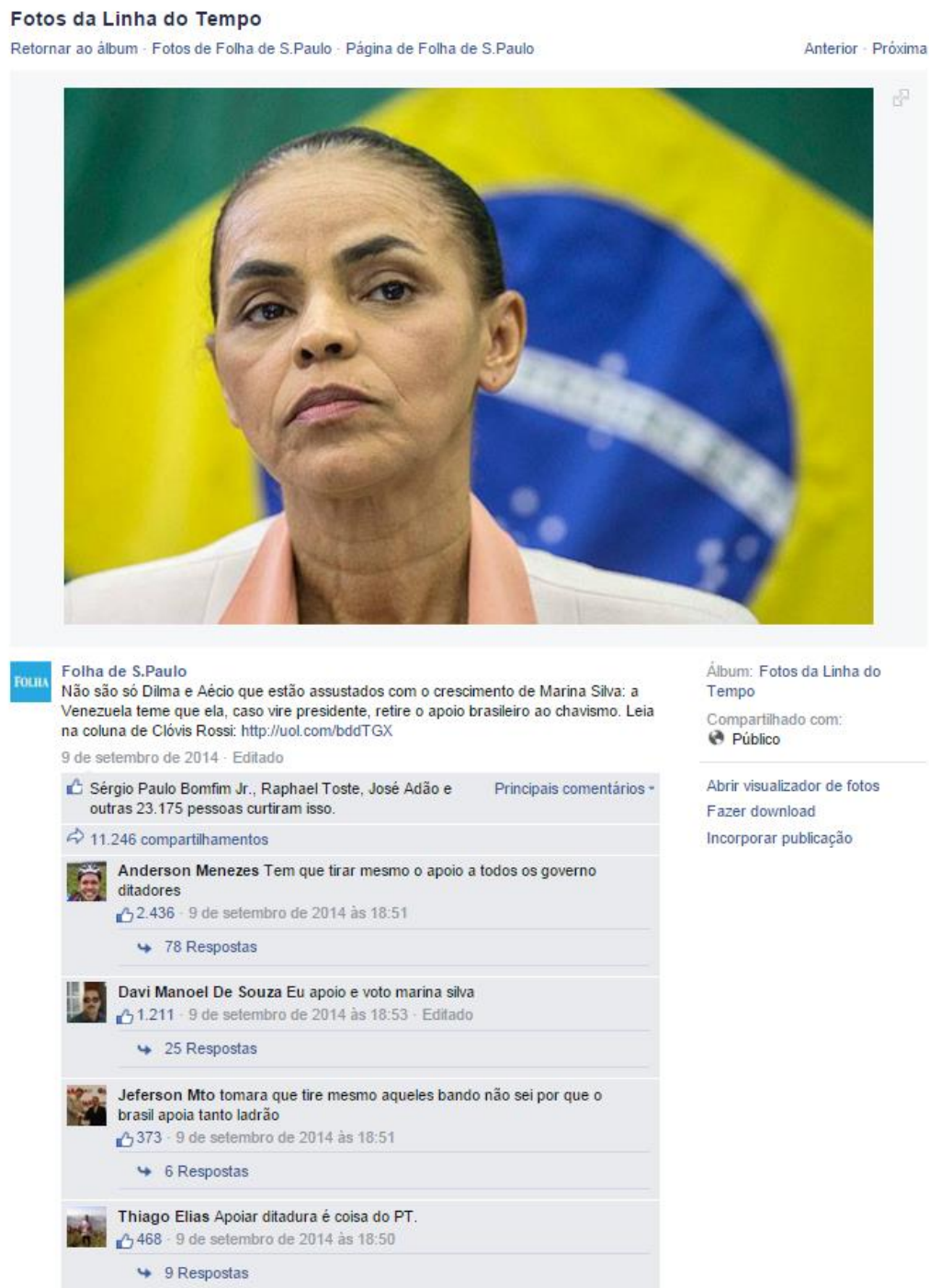
Figura 06: Postagem no Facebook do jornal Folha de S. Paulo de 9 de setembro de 2014

136