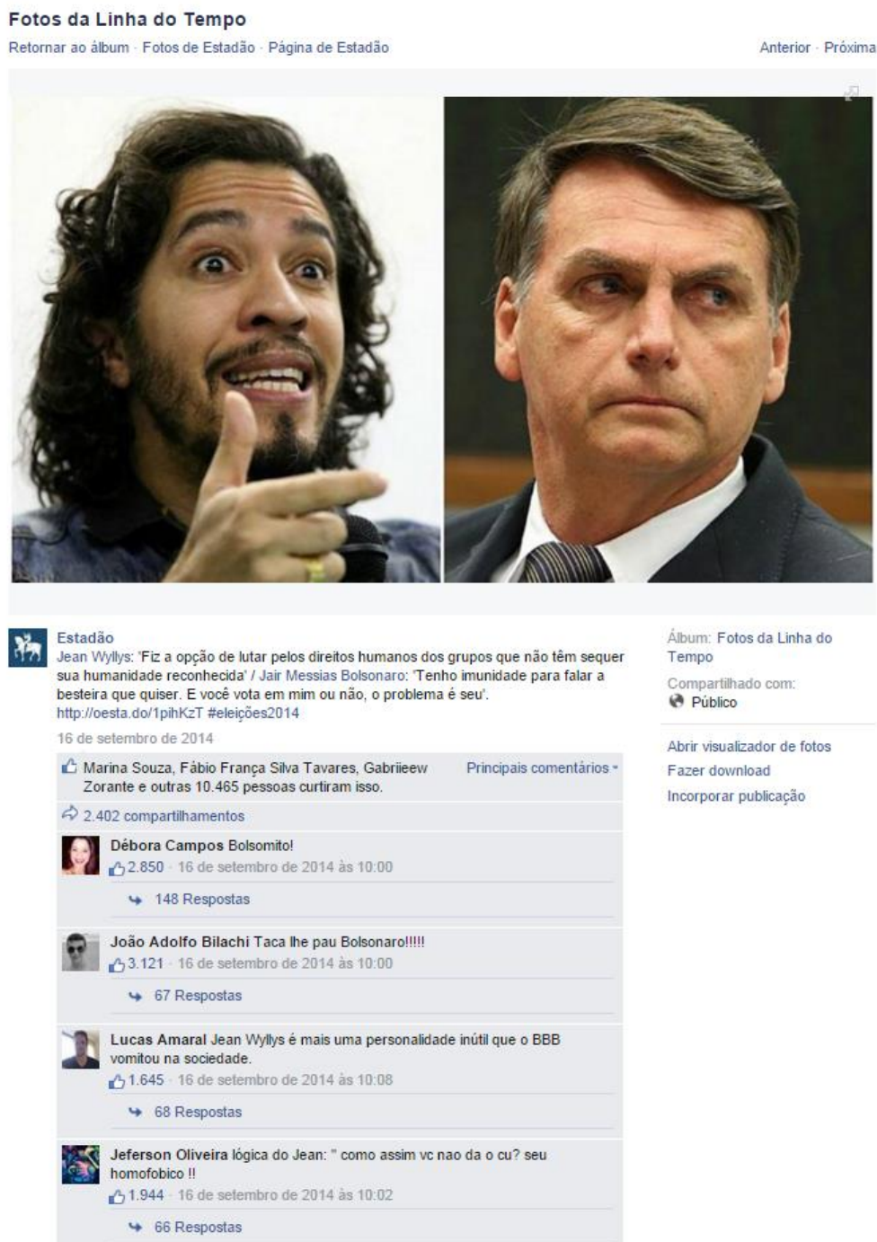
Figura 07: Postagem no Facebook do jornal O Estado de S. Paulo de 16 de setembro de 2014

137