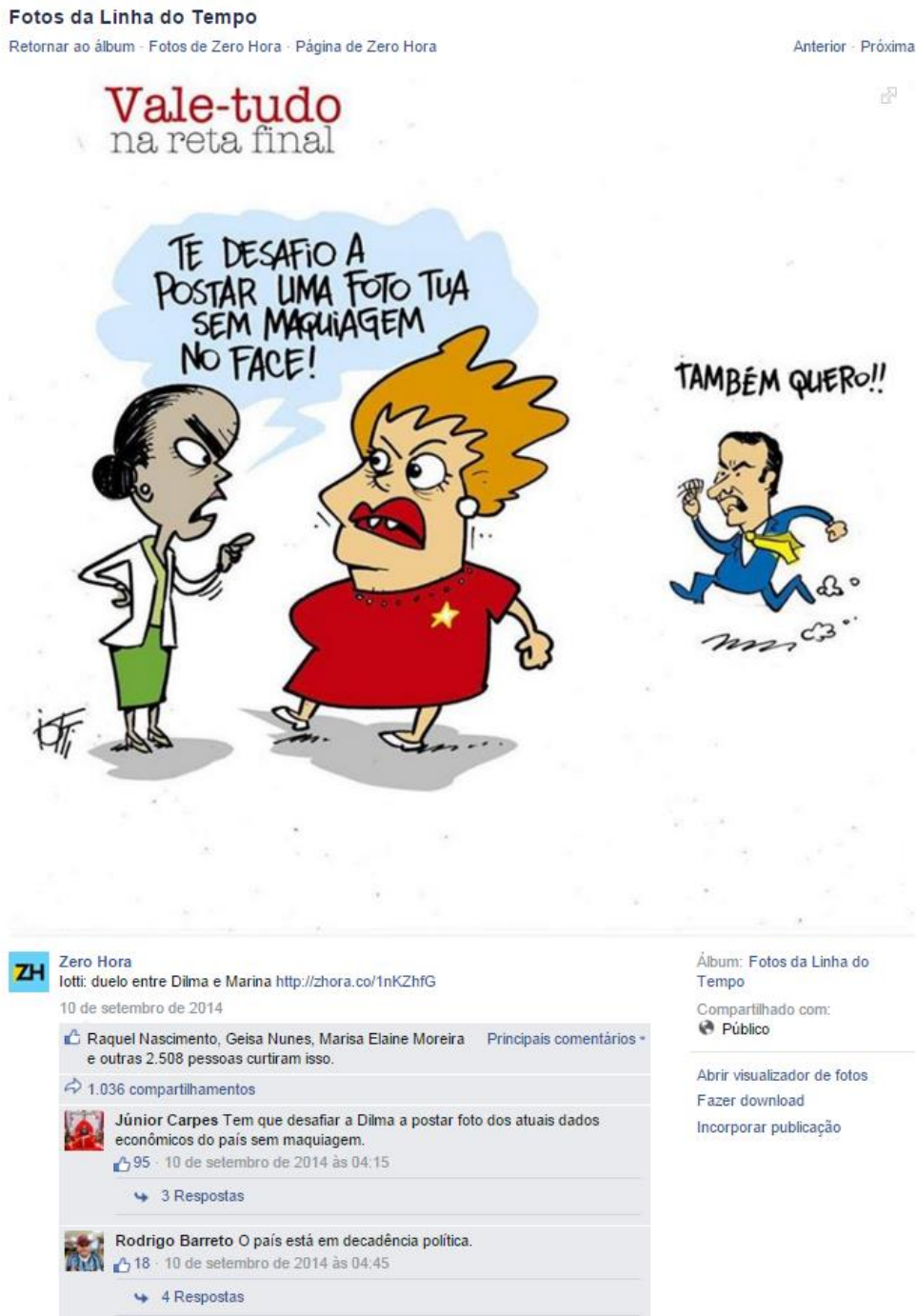
Figura 04: Postagem no Facebook do jornal Zero Hora de 10 de setembro de 2014

Fonte: página oficial do jornal no Facebook 134