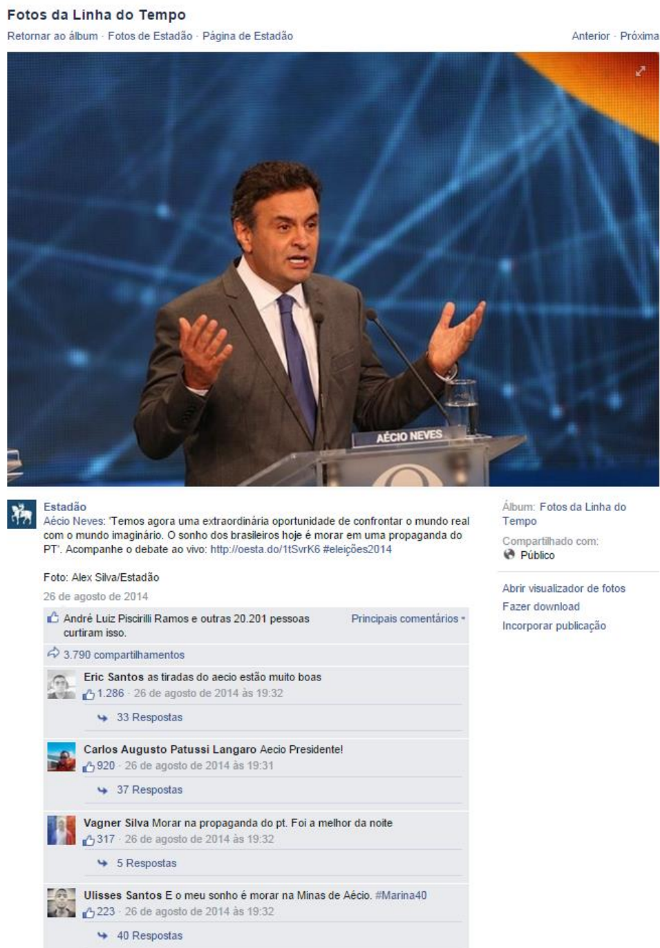
Figura 02: Postagem no Facebook do jornal O Estado de S.Paulo de 26 de agosto 2014

132