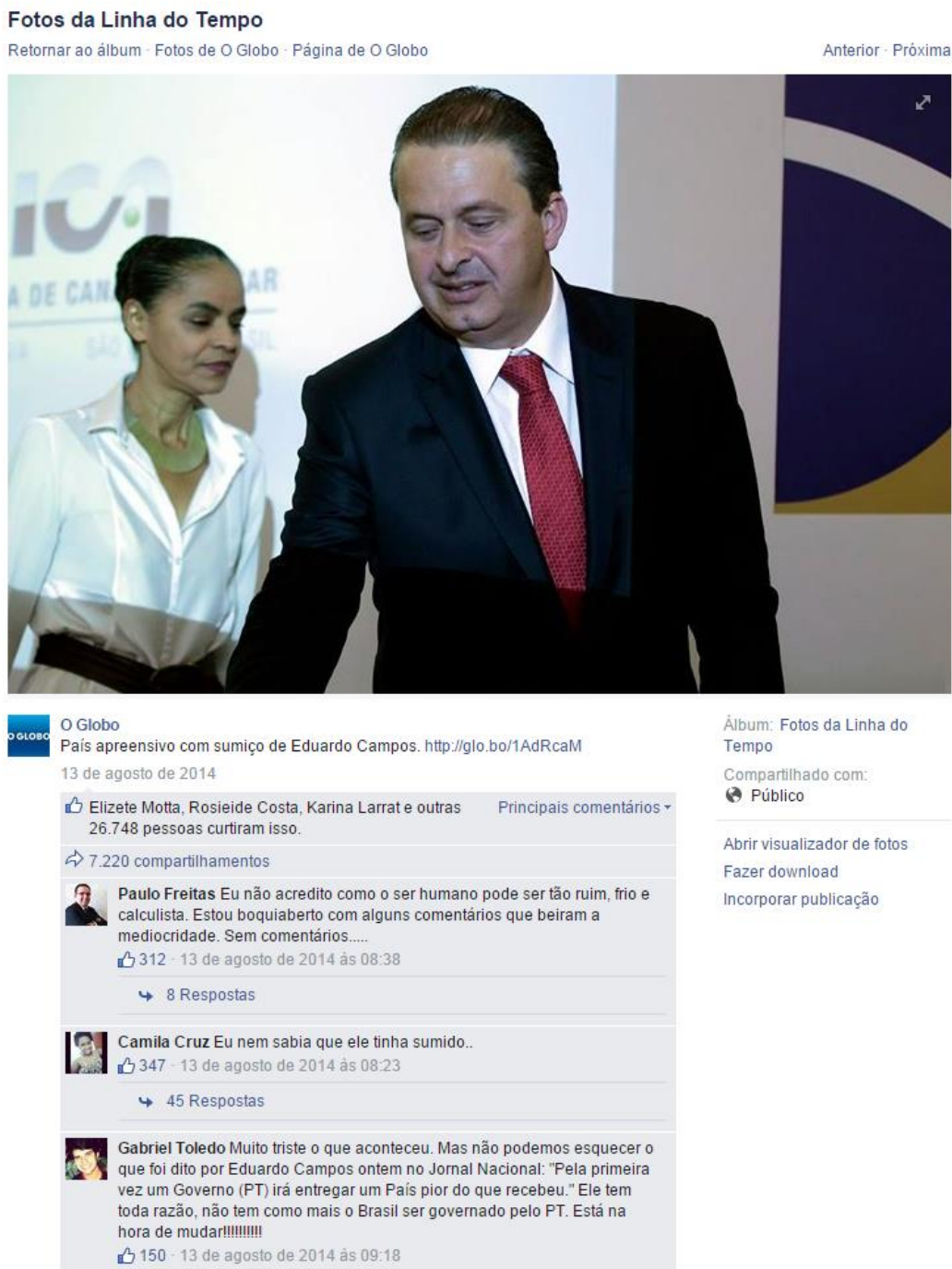
Figura 01: Postagem no Facebook do jornal O Globo de 13 de agosto de 2014

Fonte: página oficial do jornal no Facebook 131