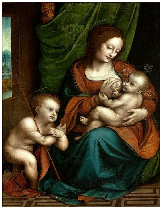
Fig. 1. Giampietrino, O menino e São João Batista criança em adoração, 1500-1520, Itália.

Segundo o Novo Testamento, e também está no Alcorão, ela teria gerado Jesus; sua gravidez acontece, no entanto, não por uma relação humana, mas por meio de um ato divino 13 . Isso ocorre quando ela estava noiva de José e aguardava o rito do casamento. Casa-se em seguida e, acompanhada pelo marido, vai a Belém, onde Jesus nasceu. O Novo Testamento começa o relato de sua vida com a anunciação, quando o anjo Gabriel apareceu a ela anunciando que Deus (aqui o Deus da crença cristã) a escolhera para ser a mãe de Jesus.