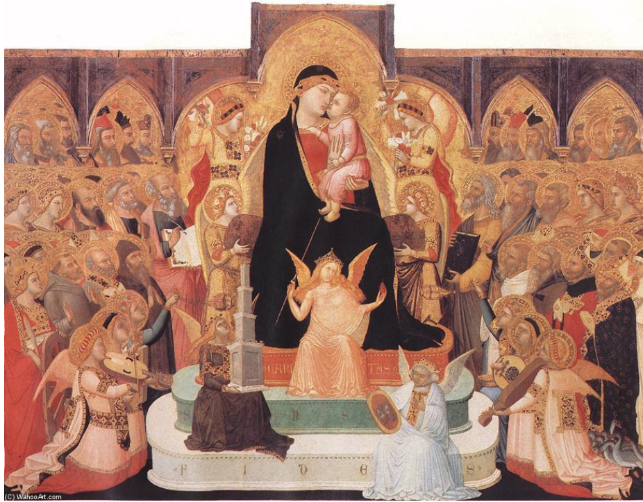
Fig. 2. Ambrogio Lorenzetti, Virgen con ángeles y saints, 1335, Itália.

não são mostrados é a ideia de que eles seriam da ordem do privado, algo que deveria ser escondido por não ser da esfera pública. Observe-se a seguinte figura de Maria.