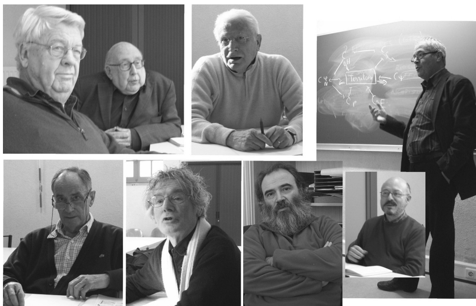
Figura 3 – Membros Dupont

Num agradável jantar, celebráramos o encerramento deste primeiro turno.