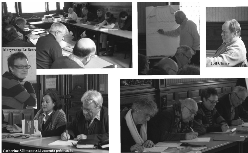
Figura 4 – Sessões de 30/01/2010 (conferências e tour de table )