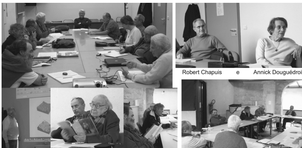
Figura 5 – Sessões de 27 e 28/01/2012 (conferências e tour de table )