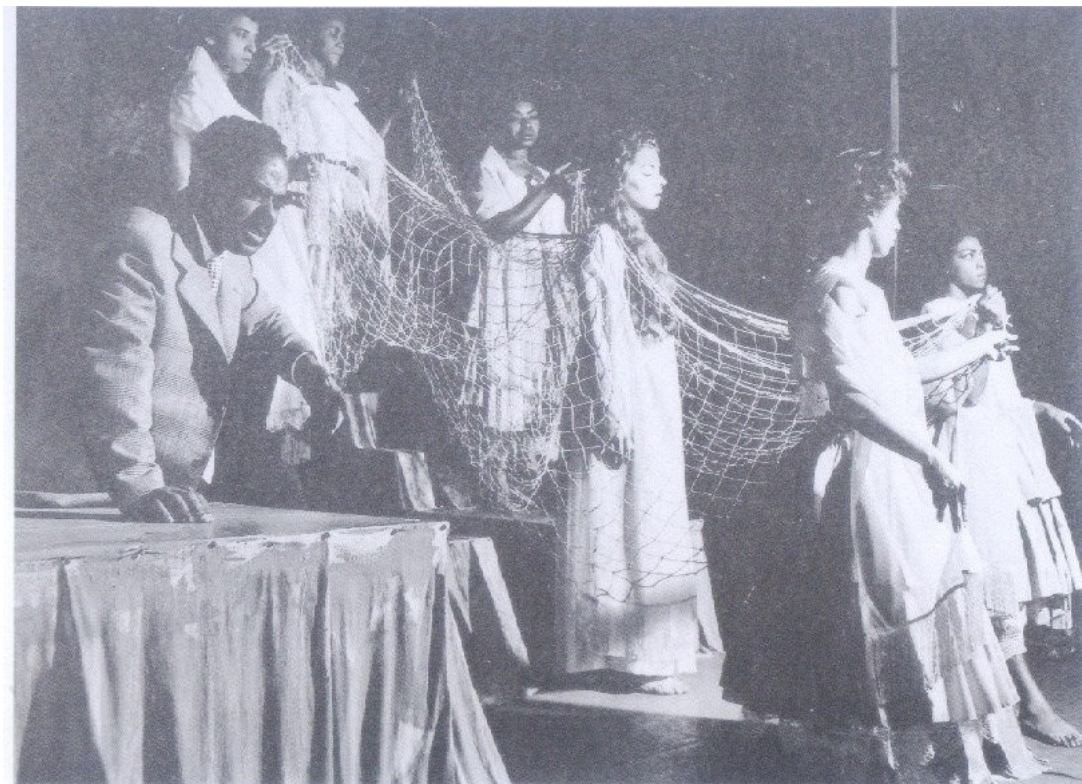
Cena das "Filhas de Yemanjá" na peça Sortilégio (Mistério negro) , de Abdias Nascimento. Teatro Municipal. Rio de Janeiro. 1957.