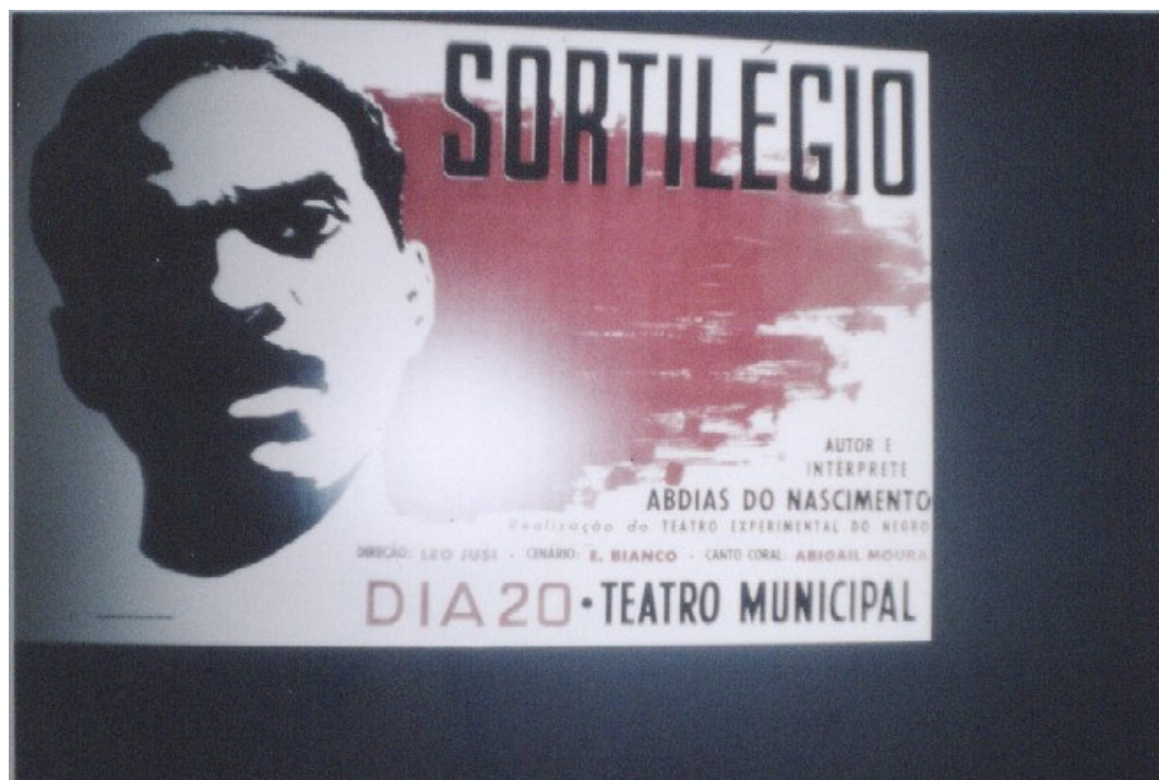
Fig. 5 Cartaz da peça Sortilégio