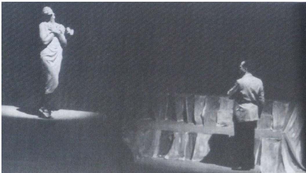
Fig. 4 Cena de Sortilégio

FONTE: Abdias do Nascimento – O griot e as muralhas, 2006, p.78