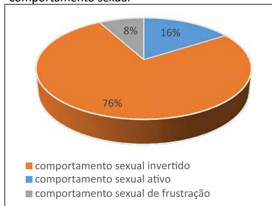
Figura 3. Xingamentos de mulheres homossexuais atribuídos a mulheres homossexuais na categoria “comportamento sexual”

O comportamento sexual permaneceu como categoria majoritária nos piores xingamentos eleitos pelas mulheres homossexuais para o seu próprio grupo (80%). Além disso, o subgrupo mais destacado dessa categoria também foi o comportamento sexual invertido (76%), seguido pelo comportamento sexual ativo (16%), e o passivo e de frustração, com 8% cada. As outras categorias que apareceram com menor frequência foram exclusão e repúdio (5%), atributos físicos (4%), traços de caráter relacional (3%), atributos intelectuais (2%) e outros (1%). Em 5% dos questionários, não houve resposta a essa questão. Percebe-se, portanto, que as mulheres homossexuais seguiram os mesmos comportamentos majoritários presentes no grupo dos homens homossexuais, homogeneizando, conseqüentemente, os resultados (Figura 3).