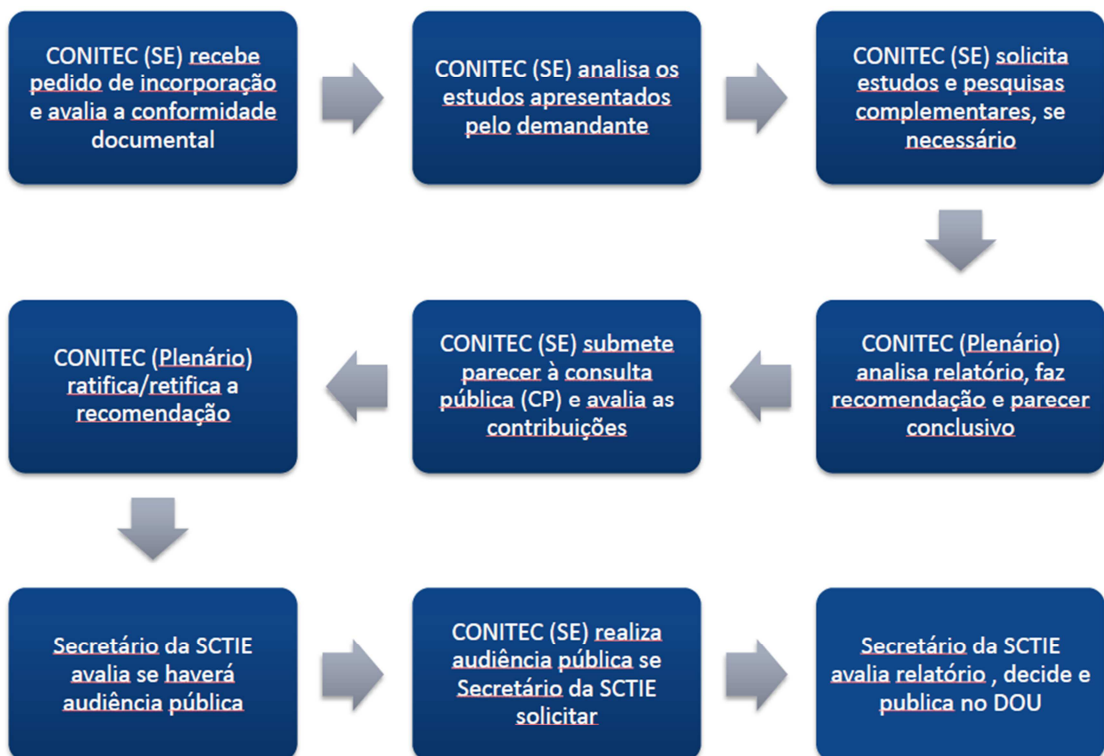
Figura 1 – Fluxo simplificado das demandas à Comissão Nacional de Incorporação de Tecnologias no SUS - CONITEC (89)

A avaliação constante das listas de medicamentos selecionados no SUS é estratégia importante não só para a promoção do uso racional de medicamentos, mas para auxiliar profissionais, gestores, usuários e outros atores quanto à tomada de decisões em seu âmbito de atuação. O Decreto 7.508, de 28 de junho de 2011, determina que o acesso universal e igualitário à assistência farmacêutica pressupõe que a prescrição deva estar em conformidade com a RENAME e os PCDT, ou na ausência desses, conter medicamentos previstos em relação complementar em nível estadual, distrital ou municipal de medicamentos (90).