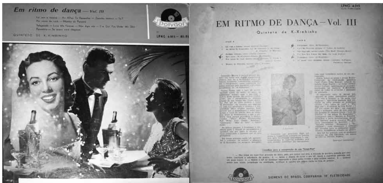
Ex.4 - Em Ritmo de Dança ; vol. 3, Polydor 1958. Capa e contra-capa.

Foi nossa intenção neste LP, apresentar o conjunto, ou melhor, o Quinteto de K-ximbinho, em arranjos dançantes e modernos, que procuram fugir um pouco a vulgaridade reinante no gênero, seja pela valorização harmônica e contrapontística do material melódico, seja pela atuação individual dos executantes, cada qual verdadeiro mestre do seu instrumento.