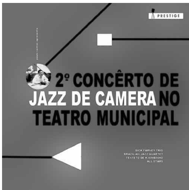
Ex.11 – 2º Concerto de Jazz de Camera no Teatro Municipal, 1960. Capa de disco.

Os elementos verificados na obra de K-ximbinho passaram por adaptações e experiências diversas ao longo de seus discos. A frase, "modernizei meu choro, sem descuidar do roteiro tradicional" (apud CAZES 1999, p.119), sintetiza todo o processo e trajetória do compositor. Conclui-se então que, processos de mudança não acontecem da noite para o dia, mas levam tempo para ajuste e não significam sucesso garantido sempre.