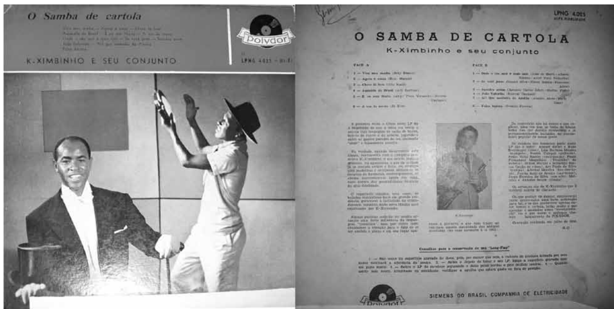
Ex.6 - O Samba de Cartola, Polydor 1958. Capa e contra-capa.