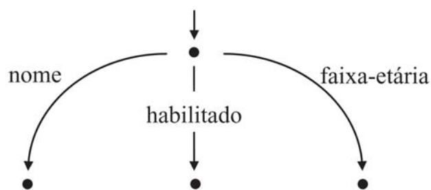
Figura 1: Grafo direcional

As estruturas de traços podem ser representadas através de matrizes de atributo-valor (MAV), como as que aparecem nas equações 1 e 2. Uma representação alternativa é na forma de grafos direcionais , onde os arcos são os traços e os vértices são os valores correspondentes, como exemplificado na Figura 1.