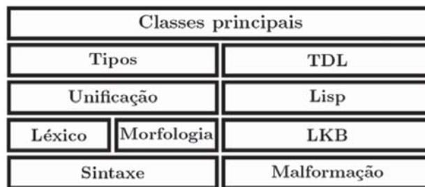
Figura 3: Visão macro