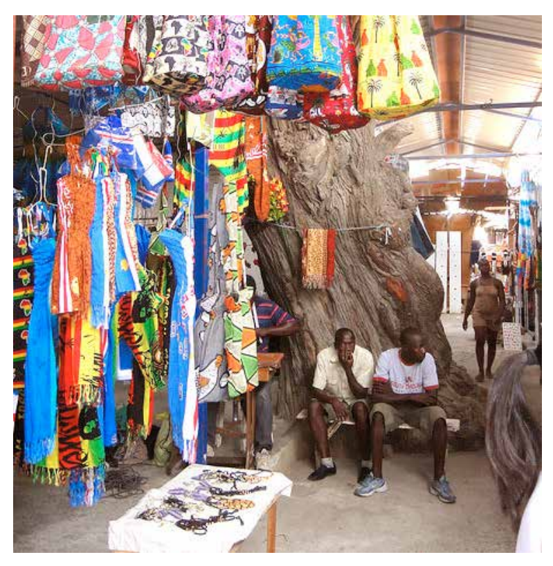
Barraca de guineenses no Mercado de Sucupira, Cidade da Praia