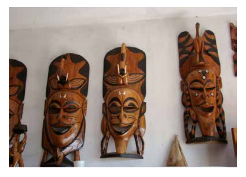
Barraca com artesanato africano