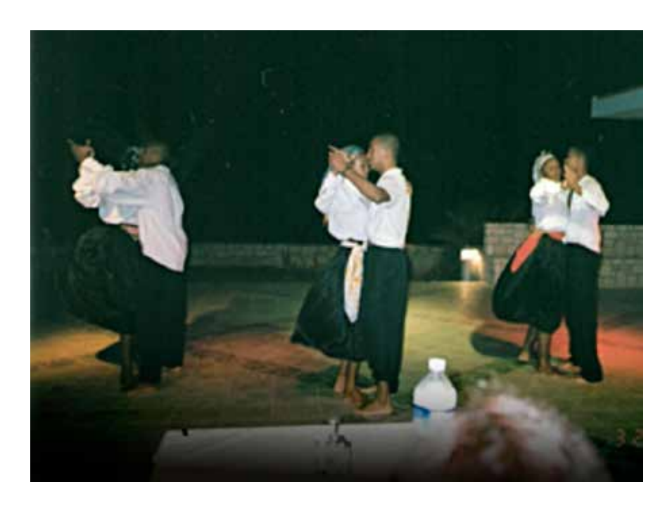
Apresentação de noite cabo-verdiana no Hotel Marine Club

As imagens do exótico e do paradisíaco são fartamente exploradas no trecho que abre este item, escrito por Germano Lima, intelectual cabo-verdiano nascido em Boa Vista. No texto publicado na revista de bordo da TACV, ele realiza uma analogia entre a ilha e uma virgem que aguarda e se oferece ao príncipe encantado. A natureza paradisíaca e exótica parece guardar continuidade com o feminino à espera do explorador, do turista – continuidade explorada aqui também na relação entre jovens locais e os turistas com quem se relacionam. A categoria amigo, também amplamente utilizada para tratar da relação entre turistas e os locais, parece sintetizar o que o visitante imagina encontrar: uma simpatia genuína e uma "amizade natural das pessoas" em continuidade com a natureza paradisíaca do lugar.<sup>19</sup>