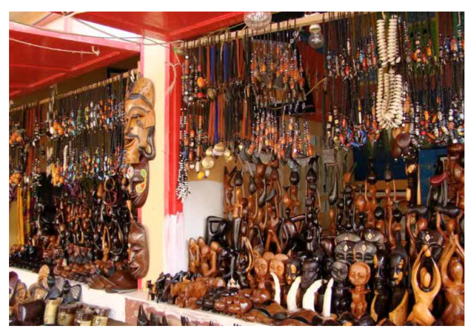
Barraca com artesanato africano