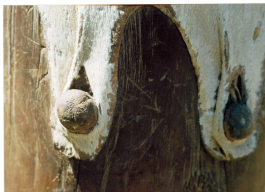
TAMBOR DE CRIOLA EM COMUNIDADE QUILOMBOLA NO MARANHÃO - BRASIL, 2010