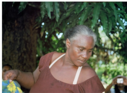
© FOTOGRAFIA: PROF. RAFAEL SANZIO. TAMBOR DE CRIOLA EM COMUNIDADE QUILOMBOLA NO MARANHÃO - BRASIL, 2010