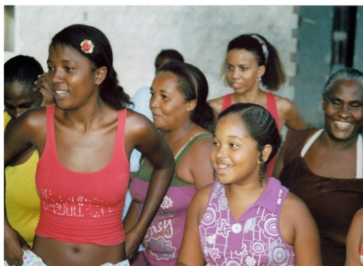
TAMBOR DE CRIOLA EM COMUNIDADE QUILOMBOLA NO MARANHÃO - BRASIL, 2010