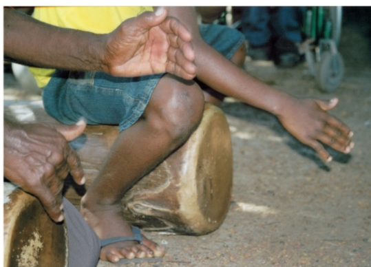
TAMBOR DE CRIOLA EM COMUNIDADE QUILOMBOLA NO MARANHÃO - BRASIL, 2010