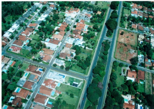
© FOTOGRAFIA: PROF. RAFAEL SANZIO. ESTRUTURA ESPACIAL DO LAGO SUL, EM BRASÍLIA, DISTRITO FEDERAL, 2010