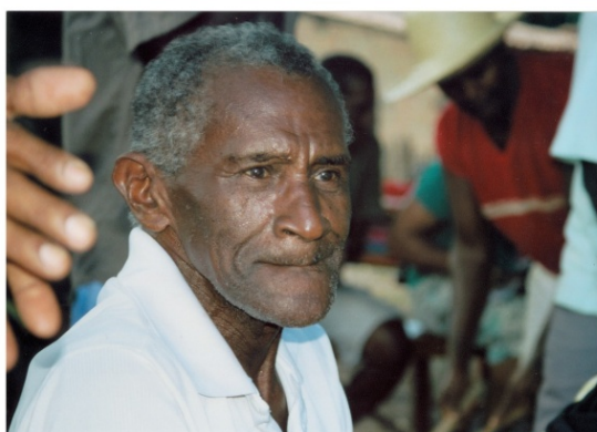
TAMBOR DE CRIOLA EM COMUNIDADE QUILOMBOLA NO MARANHÃO - BRASIL, 2010