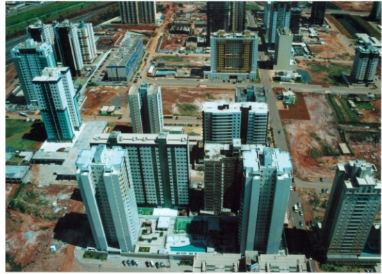
VISTA OBLÍQUA DE ÁGUAS CLARAS, DISTRITO FEDERAL, 2010