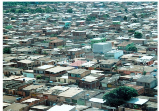
© FOTOGRAFIA: PROF. RAFAEL SANZIO. LOCALIDADE DE ALTA DENSIDADE ESPACIAL, PARANOÁ - DISTRITO FEDERAL, 2010