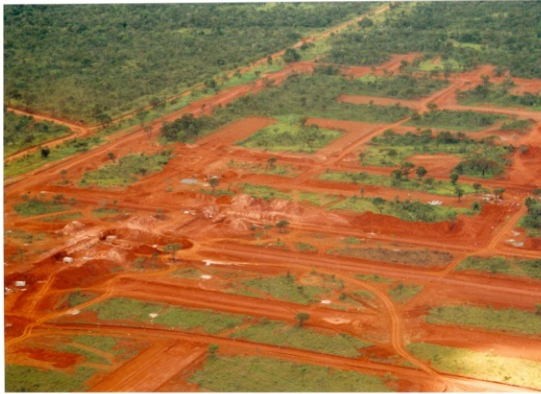
PARCELAMENTO URBANO NO LESTE DA GRANDE BRASÍLIA, DISTRITO FEDERAL, 2010