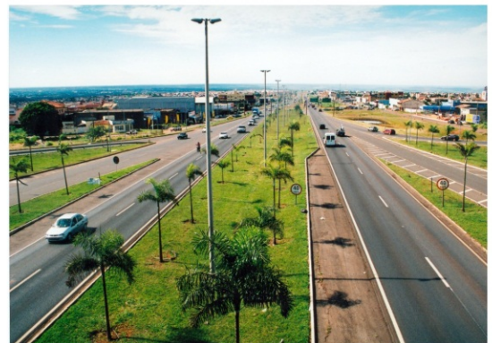
© FOTOGRAFIA: PROF. RAFAEL SANZIO. SISTEMA VIÁRIO ESTRUTURAL NO EIXO SUL DA GRANDE BRASÍLIA - DISTRITO FEDERAL, 2010