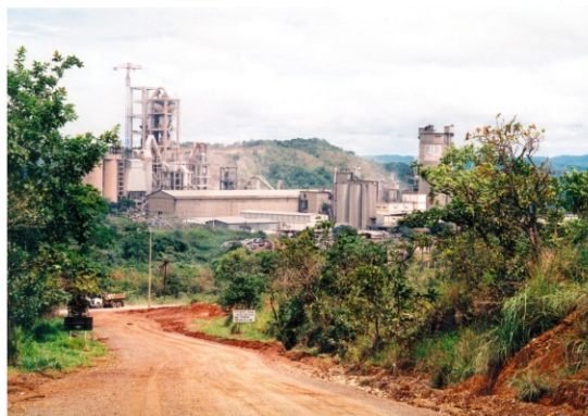
PANORÂMICA DE FÁBRICA DE CIMENTO NA FERCAL, DISTRITO FEDERAL, 2010