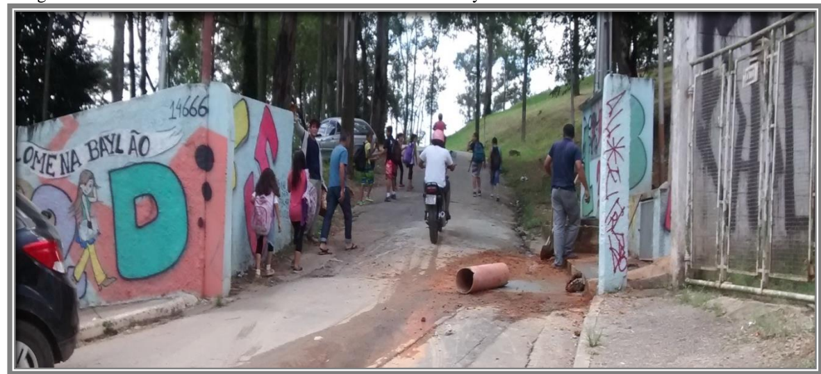
Imagem 2 – Portão de entrada da EE Professora Philomena Baylão

Fonte: fotografia de Foto: João Fernando Pereira Filho, 9 agosto de 2015, às 10h25m