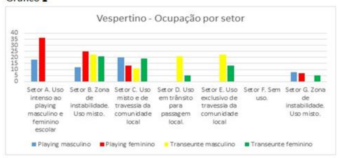
Gráfico 1 – turno vespertino: ocupação por setor Gráfico 1

Já a ocupação, por período diário, na distribuição espacial dos setores identificados pelos professores, possibilitou a construção de dois gráficos centrados na pessoa-ambiente por setor.