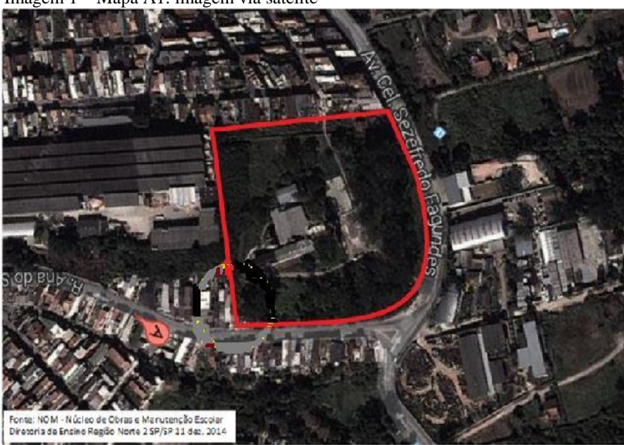
Imagem 1 – Mapa A1: imagem via satélite