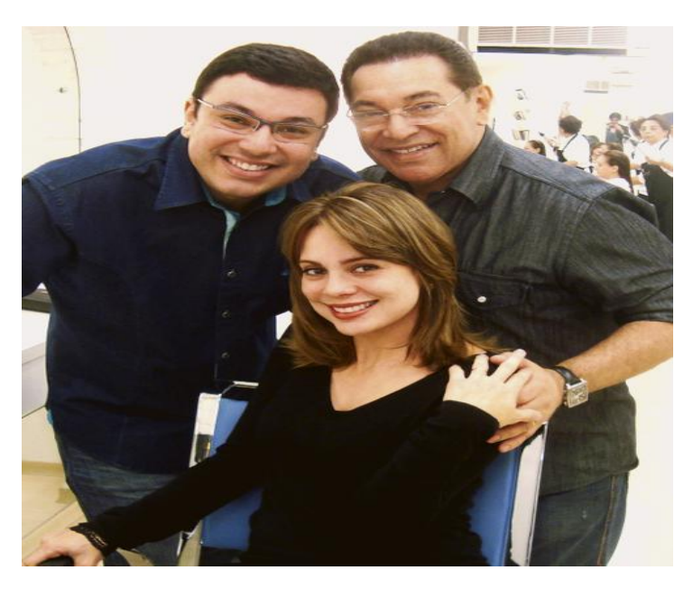
Foto 6 – Sheherazade, Jassa e seu filho apresentando o novo corte de cabelo da apresentadora

Apesar de ser a TV o espaço institucionalizado para a consolidação da fama, da aparição em revistas, jornais, foi o site youtube o causador desse deslocamento em torno da imagem da jornalista. Foram as redes sociais que promoveram a mudança na vida pessoal de Rachel Sheherazade, que alteraram a rotina produtiva de um telejornal local, que provocaram transformações em um telejornal de rede de uma importante emissora de tevê brasileira.